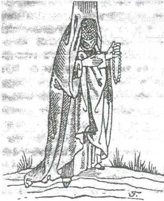
رسم رقم (٧) امرأة متدينة ممسكة بمسبحة فى يدها اليسرى، وفوق الوجه وضع الحجاب

ويحسب لأرنولد أيضا أنه عقد مقارنة بين ملابس المرأة المملوكية وملابس المرأة الأوروبية (١) .